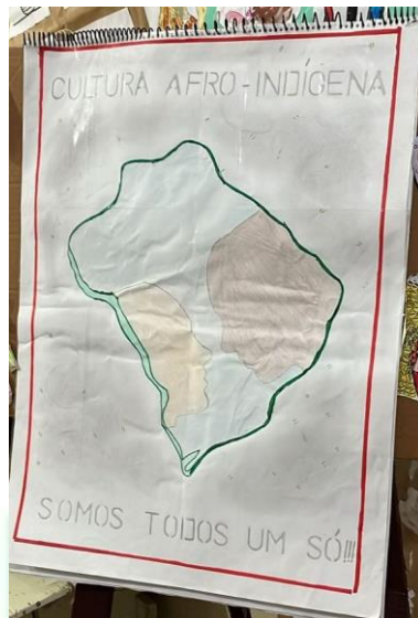
Álbum construído por nossos alunos